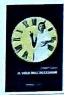
Filippo Tuena Il volo dell'occasione TerraRossa pagg. 178 euro 15,50

Lettore ideale: chi ha vissuto lo strazio de Le passanti di Fabrizio De André (da Brassens).