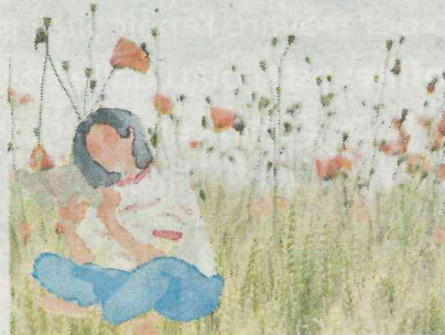
L'illustrazione della campagna per l'indagine sulla lettura a scuola

... leggono i ra- ? Indagare il gli adolescen- a lettura, per più efficaci i ori per le nuo- uesto obietti- sidi del libro, Limitone, in a Regione e regionale (e il ca) ha avviato la lettura tra role seconda- i.