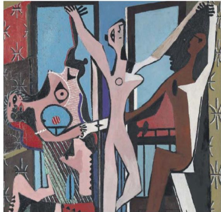
Pablo Picasso, un dettaglio di «The Three Dancers» (1925)

Livia e Zoa, le due protagoniste, si muovono dentro questa atmosfera con una specie di stanchezza disciplinata. Una viene dalla danza